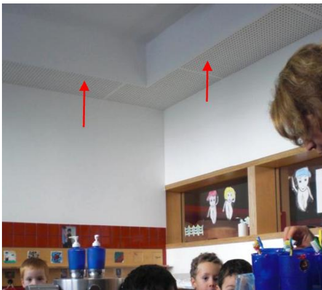
Abbildung 3: Kantenabsorber in den Waschräumen einer KITA (Foto: SOS-Kinderdorf Berlin-Moabit)

Fuchs u.a. (2012) konnten zeigen, dass der tieffrequente Nachhall im Raum ein Dröhnen erzeugt, das die besonders wichtigen hohen Frequenzen verdeckt, so die Verständlichkeit und Klarheit der Sprache beeinträchtigt und als Folge den Schallpegel massiv ansteigen lässt. Die waagrecht oder senkrecht in dafür geeigneten Kanten eines Raumes zu installierenden Kanten-Absorber mit einem Querschnitt von ca. 40 x 50 cm bedecken nur eine Fläche von weniger als 20 % der Grundfläche des Raumes. Aber die Nachhallzeit lässt sich damit bis auf 63 Hz herunter halbieren. Beleuchtung, Lüftung und andere Installationen können in die sehr robust und pflegeleicht zu bauenden Kanten-Absorber integriert werden.