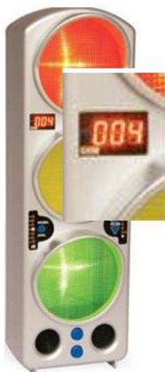
Abbildung 1: Lärmampel mit Digitalzähler

braucht man nach aller Erfahrung keine großartigen Belohnungen; es reicht aus, das Ergebnis der Bemühungen zu visualisieren und sich gemeinsam mit den Kindern über den Erfolg zu freuen - und dies auch zu artikulieren.