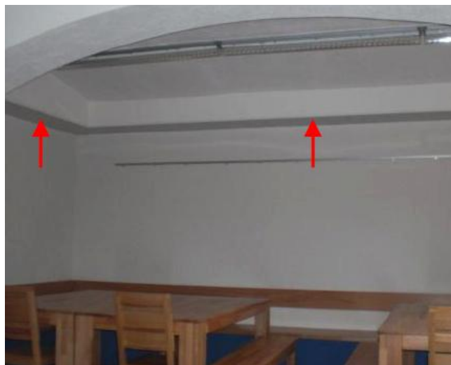
Abbildung 4: Kantenabsorber in den Kellergewölben einer Mensa in der Ersten Gemeinschaftsschule in Berlin-Mitte

Mit Kanten-Absorbern wurde beispielsweise ein zur Mensa umgebautes, niedriges Kellergewölbe einer Schule akustisch saniert. Wegen der geringen Raumhöhe wäre das mit einer traditionellen abgehängten Akustikdecke nicht möglich gewesen. Kanten-Absorber wurden auch schon als Sitzbänke in den unteren Kanten von Aufenthaltsräumen installiert. Fuchs illustriert die unterschiedlichsten Raum-Situationen mit zahlreichen Abbildungen, so dass man eine gute Vorstellung gewinnen kann, was mit dieser preiswerten und einfach nachzurüstenden Methode möglich ist. Die Ergebnisse werden so gut verständlich erläutert, dass Elternvertreter und Schulleiter nach der Lektüre in der Lage sind, der Schulträger-Verwaltung mit überzeugenden Argumenten entgegenzutreten, wenn behauptet wird, eine akustische Sanierung von Klassenzimmern, des Lehrer- oder Elternsprechzimmers – oder auch der Flure und Pausenhallen – sei nicht möglich.