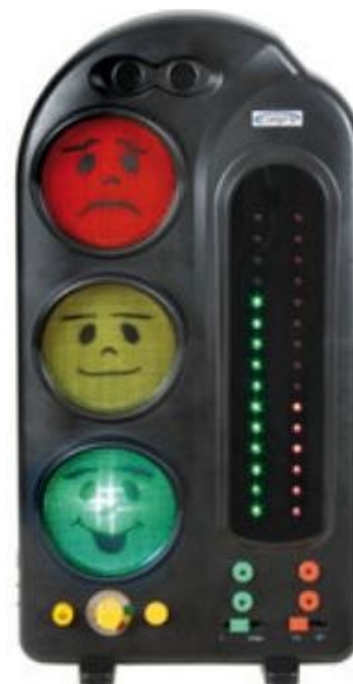
Abbildung 2: Lärmampel mit Protokoll-Funktion

Am Ende der Stunde ist es möglich, das Lärmverhalten zu diskutieren und von den Schülern selbst bewerten zu lassen. In diesem Zusammenhang kann man mit den Schülern Verhaltens-Ziele festlegen und im Verlauf des Unterrichts immer wieder nachjustieren, wie es in der klassischen Verhaltensmodifikation Standard ist. Das Gerät kann mit dem Stromnetz oder mit Mikro-Akkus betrieben werden. Die Akku-Aufladung erfolgt im Gerät. Weil das Gerät weniger empfindlich ist, eignet es sich weniger für kleinere Klassen in Grundschulen.